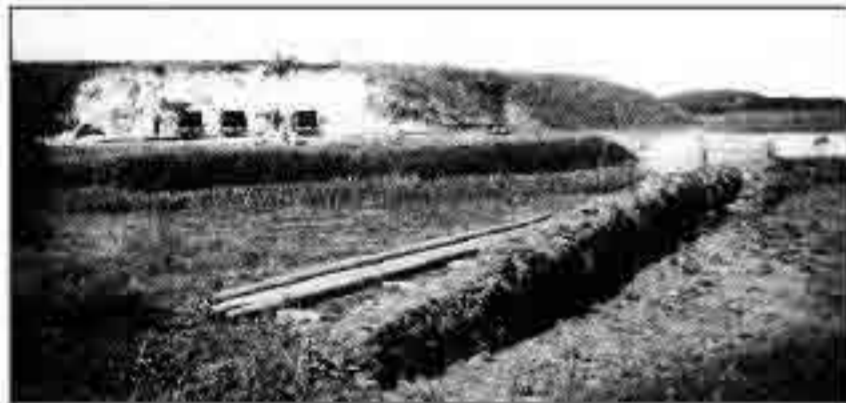
Beeld van de afgraving van fort Redoute. Op de voorgrond de wagons, waarmee de grond naar de dijk werd afgevoerd.