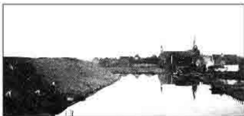
Fort Lunette in de jaren dertig. De mannen die op de foto op de wal lopen, treffen vermoedelijk voorbereidingen voor het afgraven van de aarde, ten behoeve van de dijkhverhoging.

De forten Redoute en Lunette stamden uit 1811. Napoleon liet ze bouwen ter verdediging van De Schans, de stelling die dateert in 1572 en op last van Willem de Zwijger was opgericht en door Napoleon versterkt. De twee bijforten bouwde Napoleon vanuit de redenering dat de Engelsen waarmee hij in oorlog was de tactiek hadden om de stellingen van de Fransen niet over zee, maar over land aan te vallen. Fort Lunette, gelegen tussen de Schans en Oudeschild, bestond uit een aarden wal, met een open achterzijde in de vorm van een pijl of maan (Lunette stamt af van la lune). Het geheel werd omgeven door een gracht en was aan de landzijde te betreden via een eenvoudige brug. Op het fort heeft volgens NM een houten barak gestaan en het bood plaats aan drie plateau's voor kanonnen.