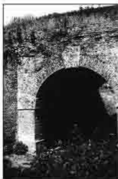
De voormalige poort van fort Redoute. Het bouwwerk diende als voorbeeld bij de restauratie van de Schans.