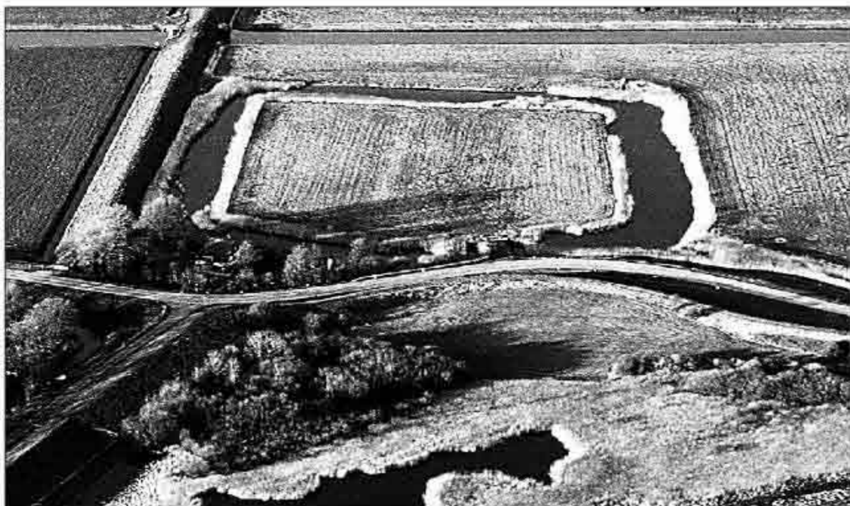
Op deze luchtfoto van de Redoute is goed te zien waar het fort vroeger heeft gelegen.