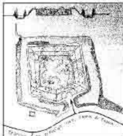
Plattegrond van de Lunette uit oktober 1812.